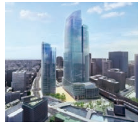
▲都市計画法等の特例・常盤橋プロジェクト (東京駅前)