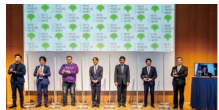
東京金融賞2021表彰式の様子